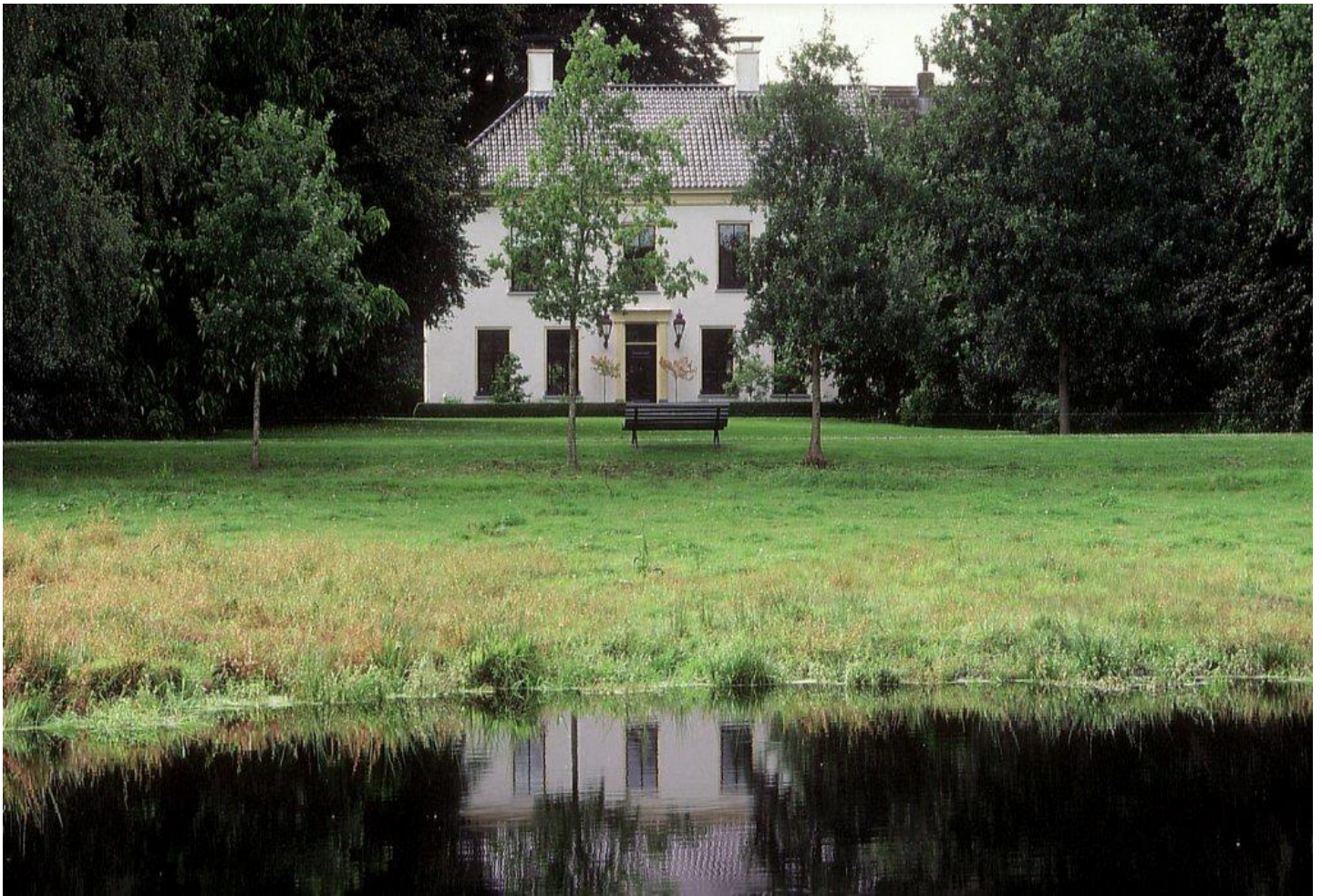
Landhuis Vledderhof

Tussen de Vledderesch en de bossen van Boschoord ligt het Landgoed Vledderhof. Het is een van de mooiste voorbeelden van een ontginningslandgoed, zoals ze in Drenthe aan het eind van de 19de eeuw op allerlei plaatsen vorm kregen. Het Drentse Landschap probeert het typische landgoedkarakter zoveel mogelijk te versterken.