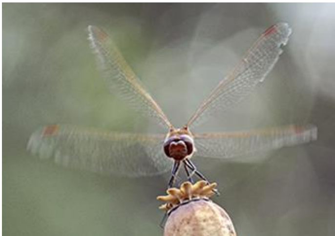
Bloedrode heidelibelle

Bij het huis en langs de oprijlaan staan tientallen, meer dan metershoge rododendrons die zich in de loop van de tijd flink hebben uitgezaaid in het eikenbos erachter. Het zijn typische struiken voor een landgoed, struiken met een chique uitstraling die zich het getemperde licht langs de oprijlaan laten welgevallen. In het voorjaar ligt over de donkergroene, glimmende bladeren een paars bloemenkleed.